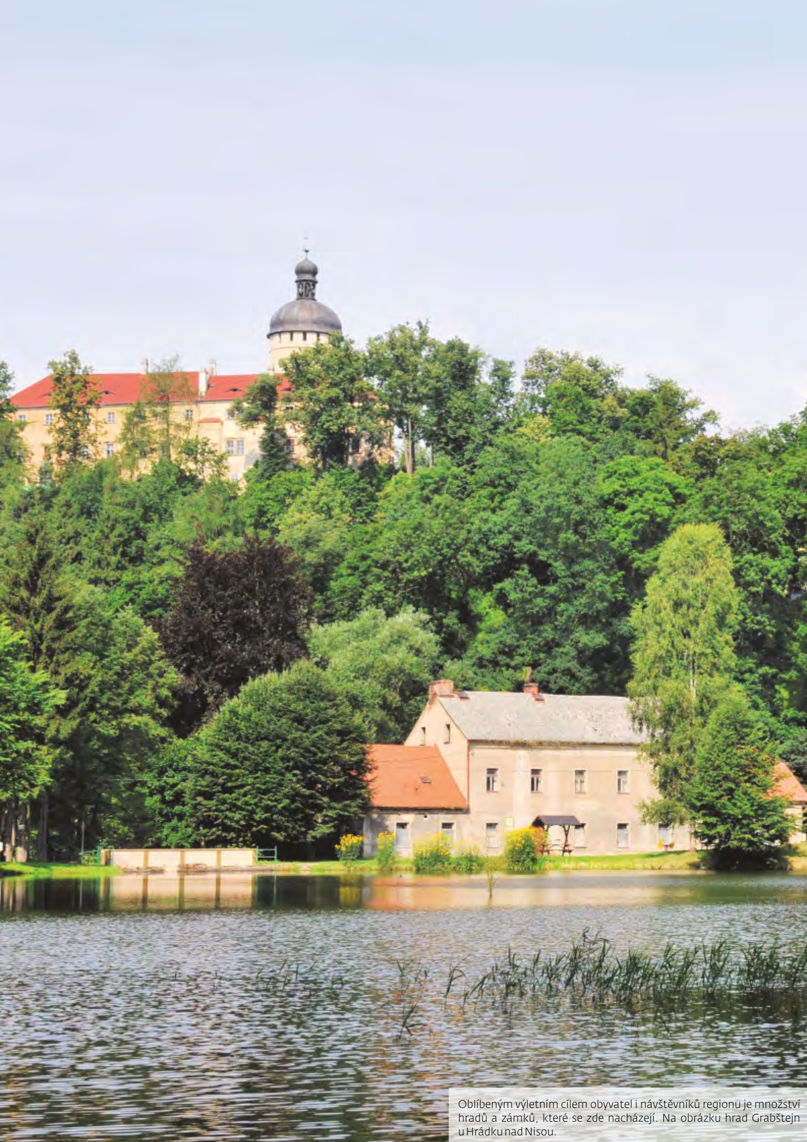
Oblíbeným výletním cílem obyvatel i návštěvníků regionu je množství hradů a zámků, které se zde nacházejí. Na obrázku hrad Grabštejn u Hrádku nad Nisou.