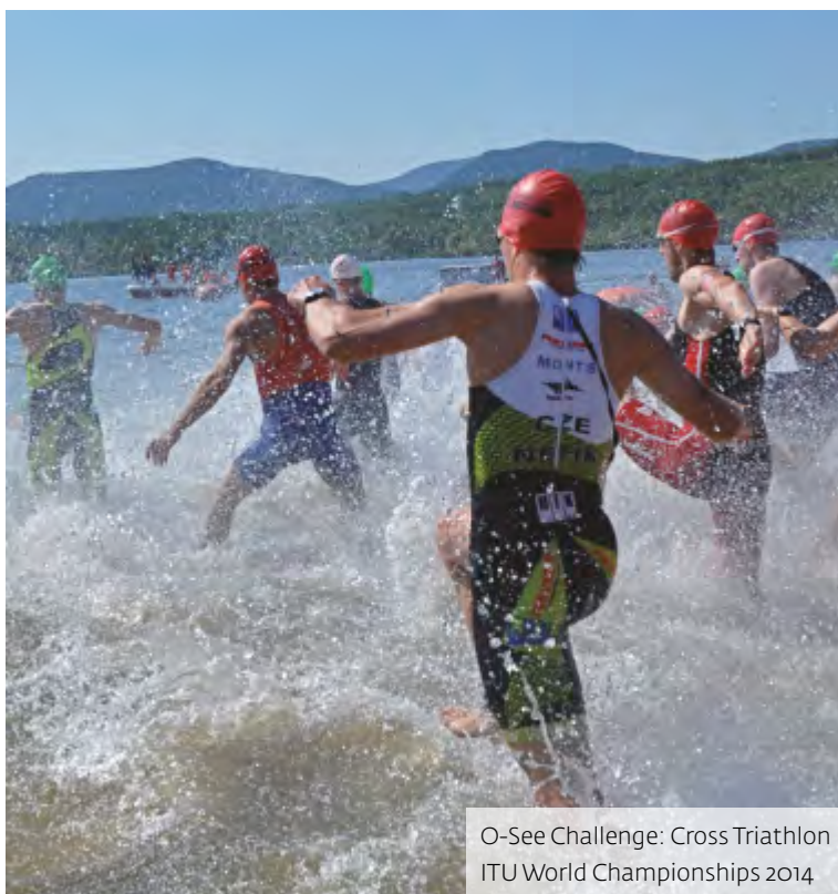
O-See Challenge: Cross Triathlon ITU World Championships 2014

Dopolední prohlídka tradičních hrázděných domů v Bogatyni, v poledne oběd s gulášem a houskovým knedlíkem u jezera Kristýna v Hrádku, odpolední cesta za odkrytím tajemství ze života vampíra Tobiáše v muzeu v Bráně Trojzemí v Hrádku n.N. nebo jedinečností postních pláten v Žitavských městských muzeích - zde v Trojzemí to vše můžete prožít každý den.