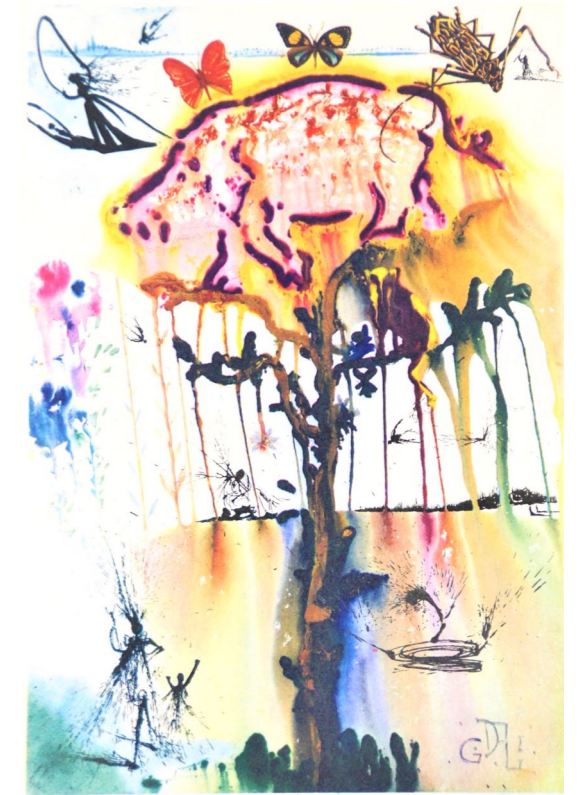
Salvador Dalí Alice in Wonderland, Pig and Pepper Farbradierung, 1969, Leihgabe aus der Sammlung Rebmann