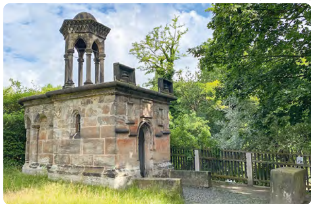
Heiliges Grab, Görlitz