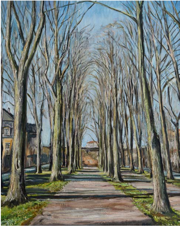
Karl Wolfgang Weber, Weinauallee im Frühjahr, Öl auf Leinwand, 2000

der Jahreszeiten und das sich damit verändernde Erscheinungsbild der Pflanzen und des Lichts eröffnen somit auch sich wandelnde Ausblicke auf die unmittelbare Umgebung. In mehrjähriger Beschäftigung mit dem Thema »Grüner Ring« entstand eine Art »Bilderchronik«, zu der genauso die historischen Bauwerke gehören. Dabei ist ein zentraler Ort seines künstlerischen Interesses die mächtige Platane, unter der im Frühjahr unzählige Krokusse blühen. Einst von Joachim Friedrich Zischling gepflanzt, wurde sie ihm später gewidmet.