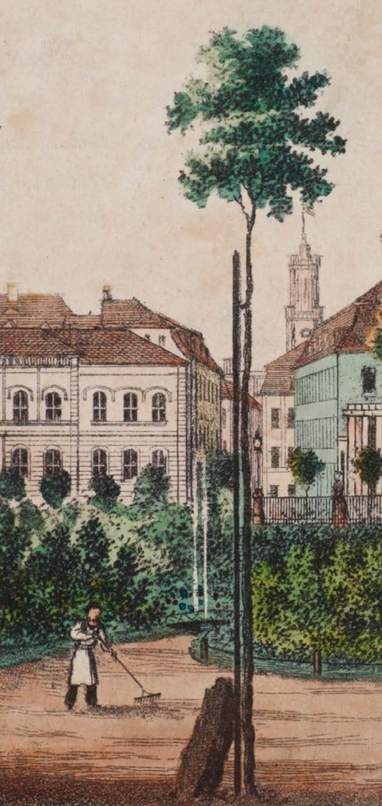
Carl Lange, Allee- bäume und Bepflanzung im Stadtgraben am ehemaligen Bautzner Tor, Ausschnitt, Feder, aquarelliert, 1823