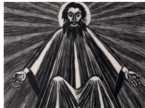
Ernst Barlach (1870–1938), Der Sternennrichter, aus: An die Freude, 1927, Holzschnitt