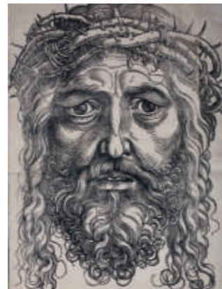
Hans Sebald Beham (1500–1550), nach Albrecht Dürer, Christuskopf mit Dornenkrone, um 1520, Holzschnitt