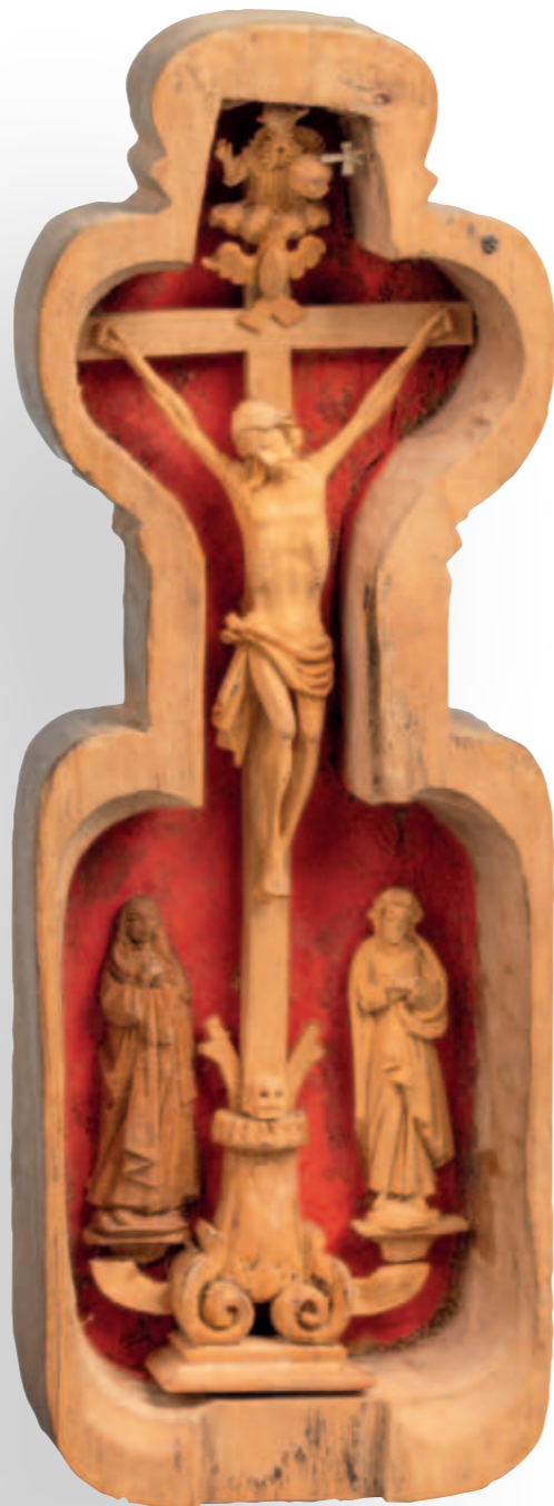
Miniaturholzschnitzerei, Christus am Kreuz mit Maria und Johannes, Holzschnitzerei in Kreuzform mit Schiebedeckel, alpenländisch, 1764