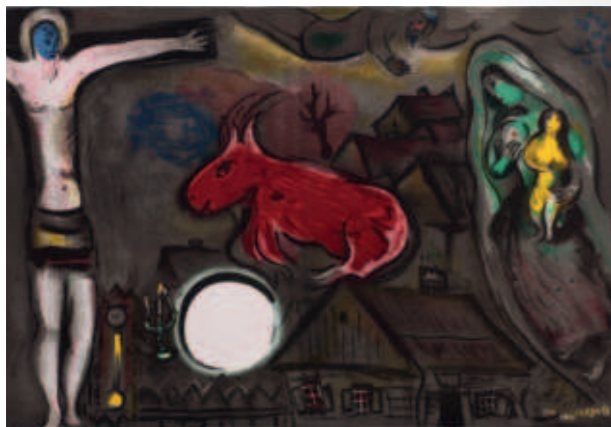
Marc Chagall (1887–1985). Der rote Ochse, 1950, Farblithografie © VG Bild-Kunst, Bonn 2024

Aus Anlass des 100. Geburtstages des Sammlers richten die Städtischen Museen Zittau eine große Ausstellung aus, in der die ganze künstlerische Vielfalt vom Mittelalter bis in die Gegenwart erlebt werden kann.