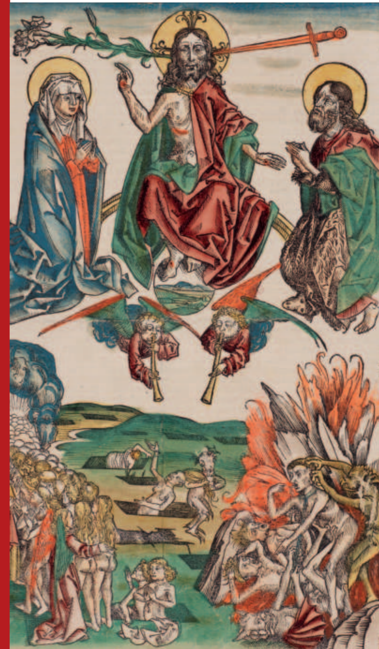
Michael Wohlgemuth (1434–1517). Das jüngste Gericht (Aus der Schedelschen Weltchronik), o. J., Holzschnitt altcoloriert