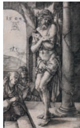
Albrecht Dürer (1471–1528), Der Schmerzensmann an der Säule, 1509, Kupferstich