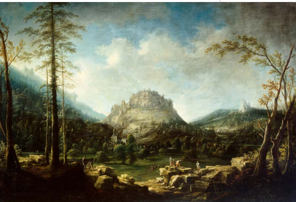
Johann Alexander Thiele, Oybin v Žitavských horách, 1745, olej na plátně, 103,0×152,0 cm

M ěstská muzea v Žitavě disponují mnohými uměleckými sbírkami, jež dosud z velké části nebyly veřejně představeny. Tato díla tvoří základ výstavy, kterou jsme rozšířili a doplnili zápůjčkami z renomovaných muzeí umění i ze soukromých sbírek.