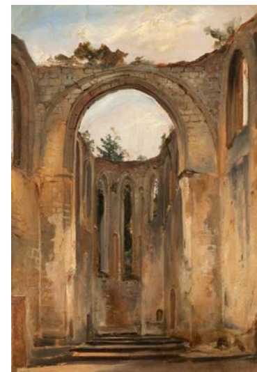
Carl Blechen, Zřícenina kláštera Oybin u Žitavy, 1823, olej na papíře na lepence, 37,5×27,0 cm

M ěstská muzea v Žitavě disponují mnohými uměleckými sbírkami, jež dosud z velké části nebyly veřejně představeny. Tato díla tvoří základ výstavy, kterou jsme rozšířili a doplnili zápůjčkami z renomovaných muzeí umění i ze soukromých sbírek.