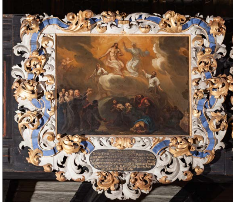
Epitaph für Christoph Paul, Zittau, 1709, Kirche zum Heiligen Kreuz

15.00 Uhr Führungen durch die Städtischen Museen Zittau Volker Dudeck/Bernd Wabersich: Museum Kirche zum Heiligen Kreuz – Großes Zittauer Fastentuch (1472), Peter Knüvener: Kulturhistorisches Museum Franziskaner- kloster