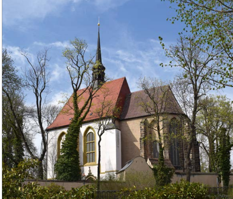
Kirche zum Heiligen Kreuz, Zittau