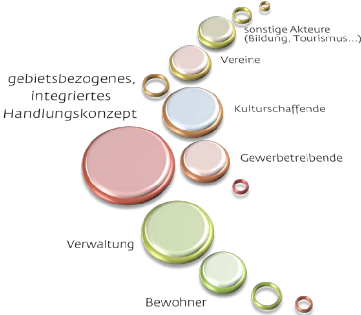
Abbildung 1.2-1 Organigramm

(Betrachtungsgemeinschaft aus Bewohnern, Gewerbetreibenden, Kulturschaffenden, Vereinen und sonstigen Aktiven) und der Stadtverwaltung wider. Das bereits 2015 aufgestellt Konzept wurde 2016/17 aktualisiert und fortgeschrieben.