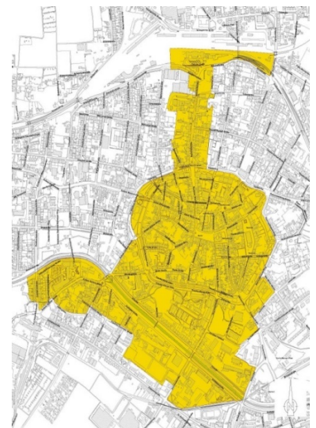
Abbildung 2.1-2 Das EFRE-/ESF-Gebiet der Förderperiode 2014-2020