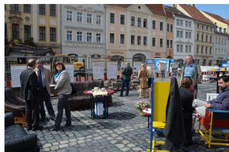
Abbildung 1.1-2 Bürgerinformationsveranstaltung

Regionale und überregionale Planungen z. B. Landesentwicklungsplan 2013, Regionalplan Oberlausitz-Niederschlesien, LEADER-Strategie finden ebenso Berücksichtigung wie städtisch sektorale. Neben dem INSEK der Großen Kreisstadt Zittau bildet das Weißbuch „Handlungskonzept Innenstadt 2015 – 2020“, welches unter hoher Beteiligung der Zittauer Einwohnerinnen und Einwohnern entstand, einen weiteren Schwerpunkt. Gleichzeitig spiegelt es das vorhandene und sich in Verstetigung befindliche Miteinander zwischen den „Zittauern“