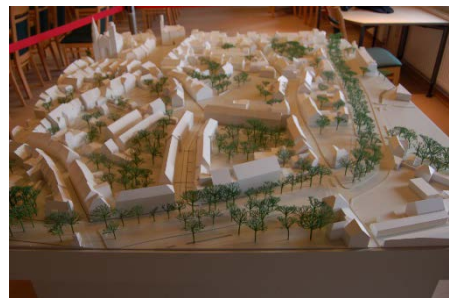
Abbildung 1.1-1 Diskussionsgrundlage Stadtmodell

Die Beteiligten setzen sich aus sehr aktiven Partnern der Stadtgesellschaft zusammen, welche ihren Schwerpunkt im Fördergebiet haben. Diese sind u. a. die Stadtwerke Zittau GmbH, die Wohnbaugesellschaft Zittau mbH, die Hochschule Zittau/Görlitz, das Internationale Hochschulinstitut Zittau, die Industrie- und Handelskammer, Handel und Gewerbe, die Städtische Dienstleistungs-GmbH als Betreiber des Stadtbades Zittau, das städtische Kinder- und Jugendhaus „Villa“ sowie soziokulturelle Akteure wie ABS Robur GmbH, Albatros e. V., Diakonie Löbau-Zittau, BAO GmbH, Freiraum Zittau e. V., Kreismusikschule Dreiländereck, Deutsche Lebens-Rettungs-Gesellschaft e.V. aber auch die SOEG GmbH (Zittauer Schmalspurbahn). Besonders hervorzuheben ist das aus dem Weißbuch-Prozess der Stadt Zittau hervorgegangene Bürgerforum Stadtentwicklung.