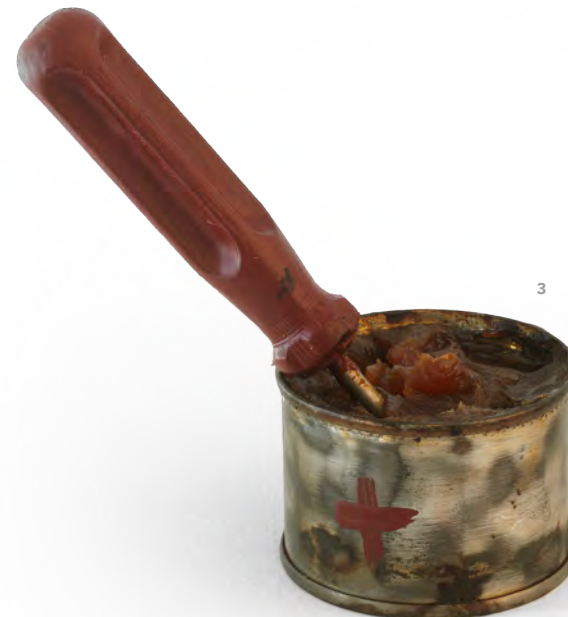
3 OBJEKT K MAZÁNÍ A OTÁČENÍ Joseph Beuys (1921–1986) 1972, Plechovka pomalovaná olejovou barvou, mazací tuk, šroubovák

Umělkyně i umělci jsou neustále v pohybu. Kromě vlastní dynamiky globalizovaného trhu s uměním určuje jejich životní cesty rovněž politické dění ve světě. Jejich díla odrážejí osobní zkušenosti i aktuální stav společnosti. Vystaveny jsou práce Mariny Abramovič, Sigmara Polkeho, Gerharda Richtera a Andy Warhola a dalších významných umělkyně a umělců z Ruska a Polska, kteří jsou u nás většinou ještě málo známí. Jejich biografie jsou poznačeny zkušenostmi migrace a politickými převraty. To se odráží v námětech jako identita a vykořenění. Umělecká díla se tak dotýkají otázek, které jsou relevantní i pro přítomnost evropského města, jakým je Zhořelec – Görlitz-Zgorzelec.