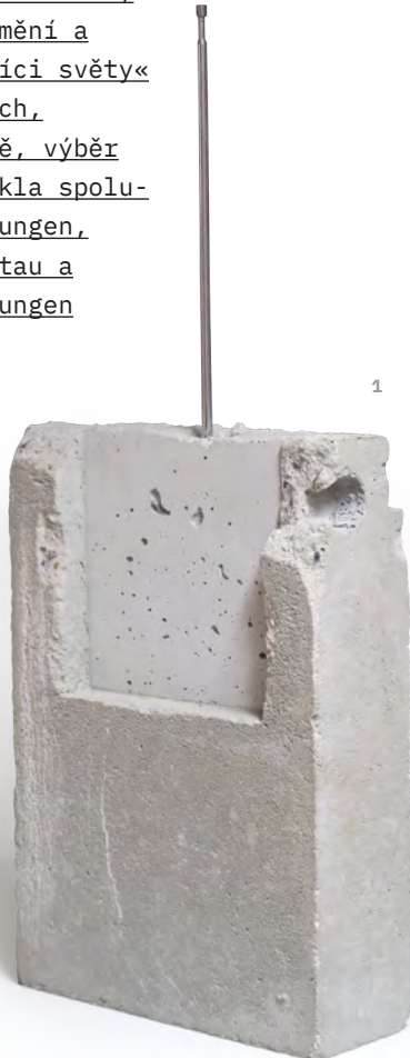
1 SVĚTOVÝ PŘIJÍMAČ Isa Genzken (*1948) 1991, beton, anténa VG Bild-Kunst, Bonn 2022