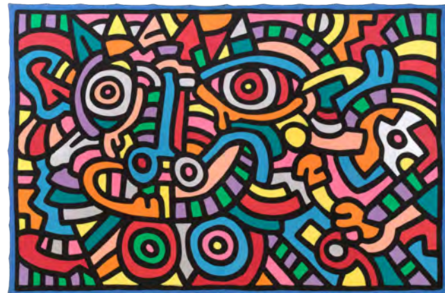
4 STÍNOVÝ OBRAZ Gerhard Richter (*1932) 1968, olej na plátně Sammlung Hoffmann, Berlin (0013)