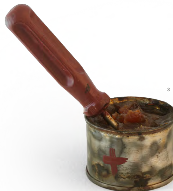
3 OBJEKT ZUM SCHMIEREN UND DREHEN [OBJEKT DO SMAROWANIA I OBRACANIA] Joseph Beuys (1921-1986) 1972, puszka pomalowana farbą olejną, smar, śrubokręt