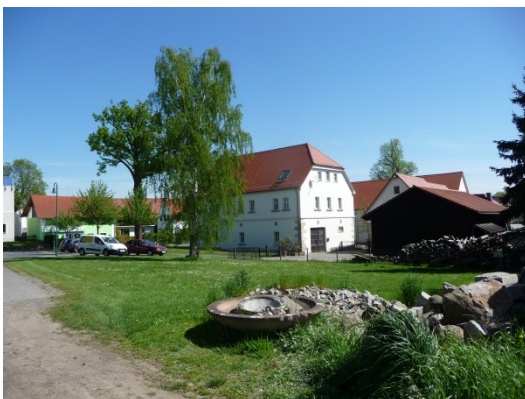
Abb.: 5 Ansicht Umgebungsbebauung