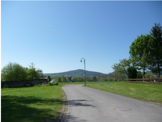
Abb.: 3 Ansicht vorhandene Zufahrt in das Plangebiet

Bestandsaufnahmen des Grundstückes und der Umgebungsbebauung