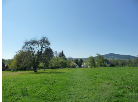
Abb.: 4 Ansicht Plangebiet