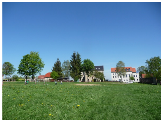
Abb.: 6 Ansicht Umgebungsbebauung Hauptstraße