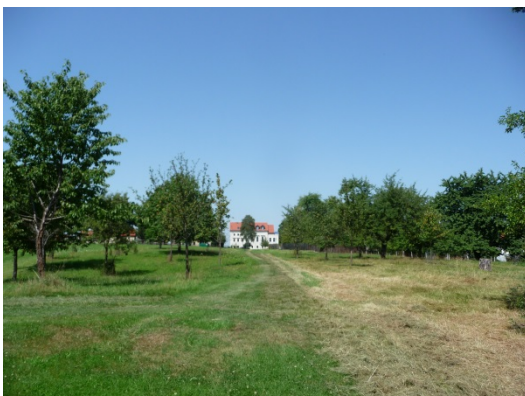
Abb.: 7 Streuobstwiese