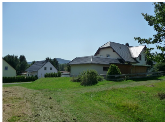
Abb.: 8 Bebauung Härteltsweg