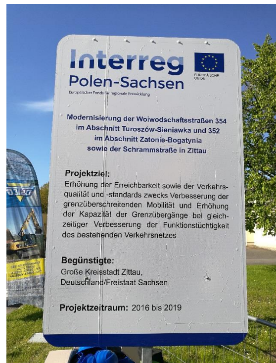
Hinweisschild lt. zur Förderung des Projektes aus Mitteln des Kooperationsprogramms INTERREG Polen – Sachsen 2014 – 2020