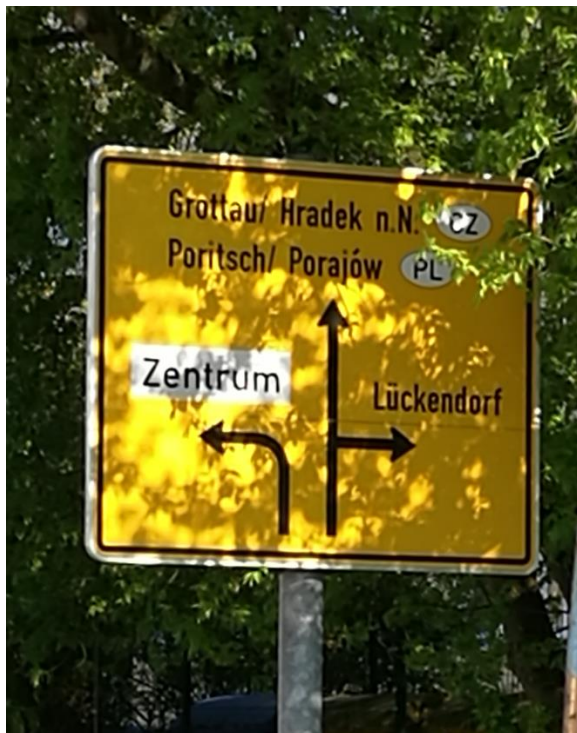
Die Schrammstraße ist eine der wichtigsten Verbindungsstraßen für den Grenzverkehr im Dreiländereck.